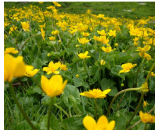
Populage des marais