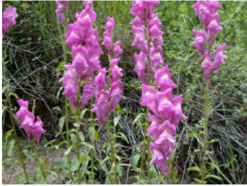
Gueule de Loup

Ramenés sur le droit chemin, nous suivons la piste forestière pendant 2h30 puis 1h30 de raidillon.