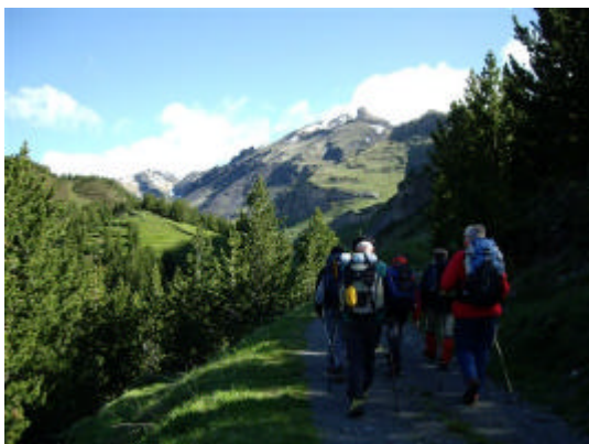
Entre ombre et soleil

Départ sous un soleil radieux, nous rejoignons vendredi soir notre bivouac bétonné sur 2 étages à Salardu. Le temps est superbe et la vue du balcon englobe la Maladetta.