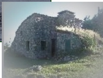
Cabane du Pic du Gar