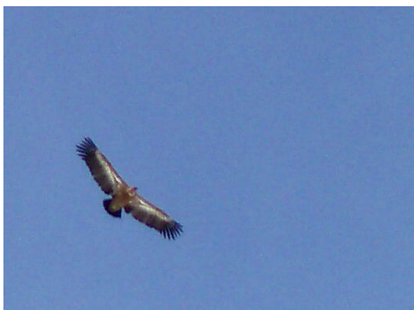
Vautour au dessus du sommet