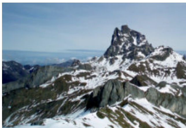
Pic du Midi d'Ossau

Photos et trace GPS : Guy ; Texte : Jean