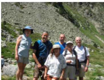
Merci Rosy !