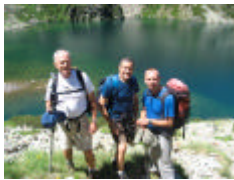
Les 3 hommes du pic descendant vers les dames du lac...

La descente aussi demandera toute notre attention et concentration sur les grosses racines au milieu de la sente, nous descendrons avec la magnifique vue du lac.