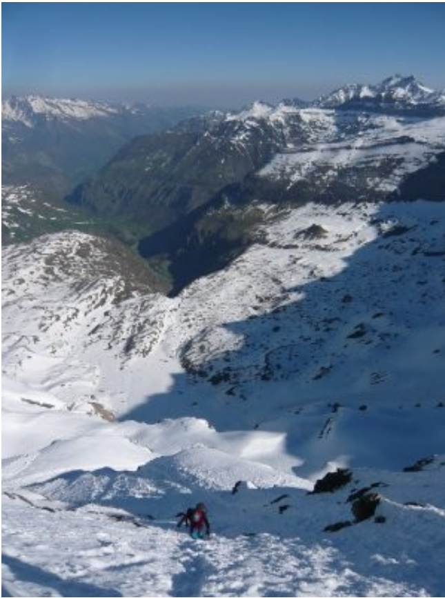
La montée au dessus du cirque de Troumouse

Le cirque de Troumouse dans la nuit est magnifique! Le jour se lève alors que nous arrivons au pied de la face nord de la Munia à 7h (2400m). Nous laissons bâtons et raquettes au pied du couloir et nous équipons de crampons et piolets. Pour le moment la neige est tendre et l'encordement n'est pas nécessaire.