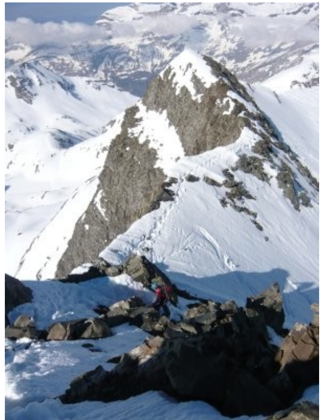
Arrivée en crête

On brasse beaucoup dans le premier couloir, Marc se charge de faire une trace, ou plutôt la tranchée. En montant la neige devient portante et nous montons plus rapidement. Au fur et à mesure que nous montons, le paysage est de plus en plus grandiose! Nous aboutissons enfin en crête vers 10h. En suivant la crête, nous arrivons au sommet vers 10h15. Finalement l'encordement n'aura pas été nécessaire pour cette sortie (avec les conditions de neige que nous avons rencontrées).