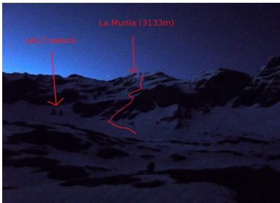
Le cirque de Troumouse vers 6h du matin

Réveil 3h30, on se prépare, on déjeune, et on monte en voiture au Maillet (1800m). La route est fermée, déneigement en cours. On est en marche à 4h30. En arrivant au parking (2100m) à 5h30, on chausse les raquettes. La luminosité de la neige nous permet d'éteindre les frontales. Nous distinguons bien dans la nuit notre objectif et l'orientation en est facilitée.