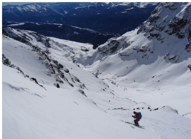
Figure 3 La descente. Martine s'élanche dans les traces de Fred

La neige est sublime et immaculée. Il faut croire que la combe bien qu'exposée sud reste assez froide. Quel bonheur qu'un groupe passé par là 3 jours auparavant ait confirmé le tuyau à Fred ! Nous serons visiblement les seuls à y passer ce dimanche. [Commentaire de Fred : en plus mes compagnons m'ont octroyé le privilège de jouer le fusible, et j'ai eu le plaisir de faire ma trace dans une neige immaculée]