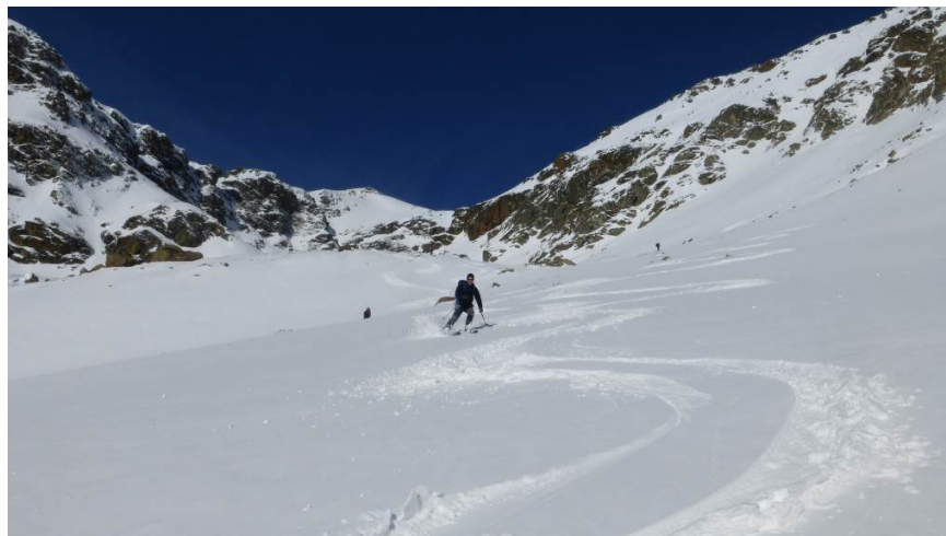
Figure 4 Pas âme qui vive à part nous depuis que nous avons quitté le sommet

13H00 : Nous atteignons un 1 er replat (1880m) ; une autre petite descente en obliquant vers l'ouest et nous ne sommes déjà plus que 100m au-dessus de la forêt, il faut penser à rejoindre l'itinéraire de montée en partant en traversée vers l'Ouest. En fonction de sa gourmandise et du prix à payer pour remonter, chacun adapte sa trajectoire. Dans tous les cas, il faut « repeater » pour 50m environs. De ce côté-ci, la neige est déjà bien transformée et alourdie. Nous nous faufileons au milieu des genêts pour rejoindre le bois puis le parking à 14H30 pendant que d'autres groupes continuent de partir à l'assaut du sommet.