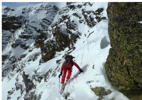
Figure 2 - le départ au col

12H30 : En fait, la solution est simple : il faut contourner le sommet à pied par le nord et descendre à ski direction Est vers le col (2215m). Au niveau du col, on bascule dans la combe du trou de l'ours (côté sud). Le passage du col est un peu raide et nécessite un minimum de concentration. Nous passons un par un et nous retrouvons plongés dans une toute autre ambiance : de grandes parois rocheuses sombres illuminées de lichens jaunes vifs encerclent la combe et lui donnent une apparence de paysage de haute montagne. [commentaire de Fred : le départ est un peu impressionnant (pas loin de 40° d'après la carte, mais la pente se couche très vite en une pente soutenue certes, 30-35°, mais bien large]