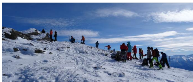
Figure 1 - la pause s'impose au sommet – très fréquenté

10H30 – Vers 2000m, le vent commence à se faire sentir et même si la pente devient un peu moins raide, les couteaux se révèlent utiles car la neige, bien soufflée, est beaucoup plus dure. Nous découvrons aussi une file ininterrompue de groupes de skieurs derrière nous et d'autres groupes provenant des Monts d'Olmes par le col de Girabal.