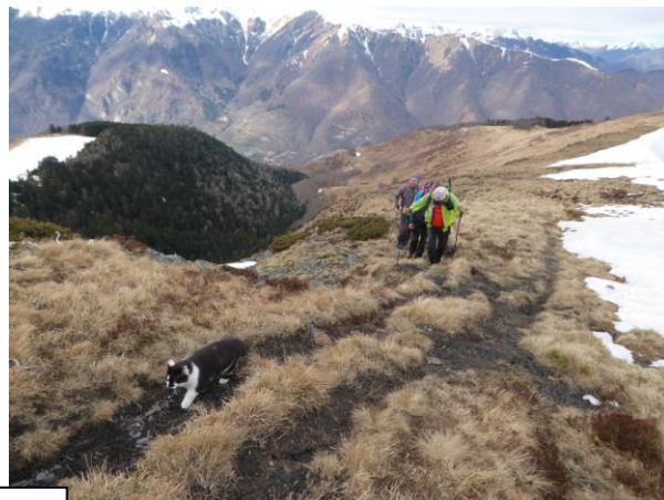
Fin du chat pitre ;-)