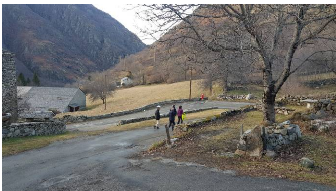
Retour au gîte

Après quelques virages dans la première pente, la majeure partie de la descente s'effectue en traversée qui réclame parfois de pousser sur les bâtons. Nous revenons aux voitures vers 13h30, au moment où l'atmosphère commence à s'assécher et les premières trouées de ciel bleu apparaître. Nous avons hâte de nous sécher et descendons au très confortable et accueillant gîte du Nabre à Mérens-les-vals. Nous nous y installons avant d'accompagner notre pique-nique de bière locale dans la salle prévue à cet effet. Après le repas et une douche chaude, quelques uns partent visiter les sources d'eau chaude à 20 minutes du gîte.