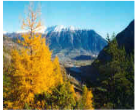
Vue sur Guillestre

La convivialité d'un accueil chaleureux et montagnard , une cuisine familiale réalisée à partir d'aliments issus de l'agriculture biologique . C'est bon et copieux.