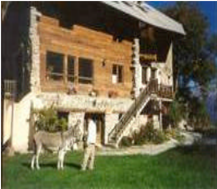
Notre lieu de repos : le gîte